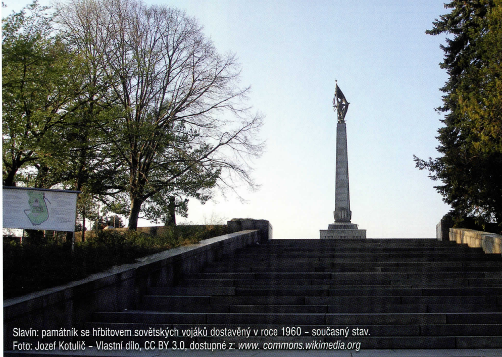
Slavín: památník se hřbitovem sovětských vojáků dostavěný v roce 1960 – současný stav.

Pracovní náplní byly především návrhy výsadby, jejich zakládání a později i údržba. Středisko mělo zpočátku 25 pracovníků, ale když se začaly realizovat bratislavská sídliště – Miletičova, Februárka nebo celý Slavín s mohutným sousoším připomínajícím padlé sovětské vojáky od so-