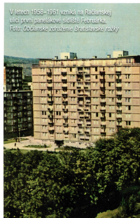
V letech 1958–1961 vzniká na Račianskej ulici první panelákové sídliště Februárka.