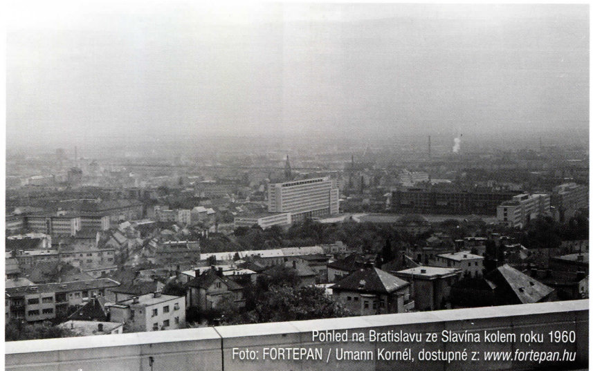
Pohled na Bratislavu ze Slavína kolem roku 1960