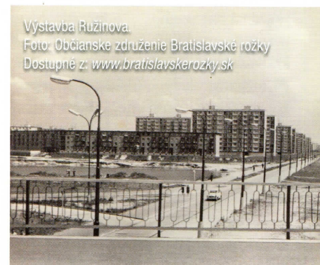
Výstavba Ružínova.

V té době se v Bratislavě střetlo ně- kolik základních faktorů. Potřeba výstavby bytů, Zákon o územním plánování, komunistická vůle a touha