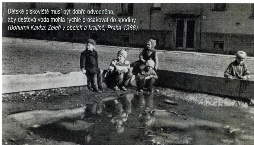
Dětské pískoviště musí být dobře odvodněno, aby dešťová voda mohla rychle prosakovat do spodiny (Bohumil Kavka: Zelen v obcích a krajíně, Praha 1966).